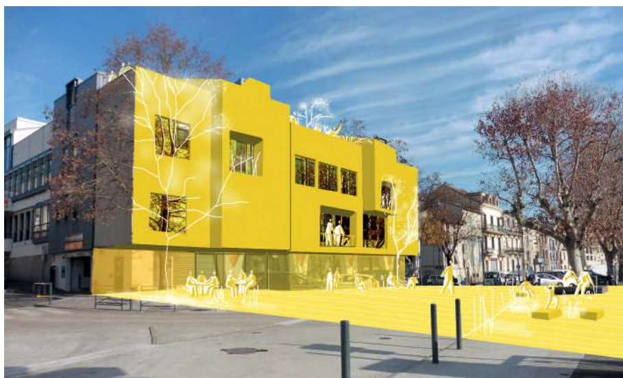
Retrouver une fluidité des liaisons entre Fanal et les espaces publics qui le bordent, en particulier les quais de l'Isère