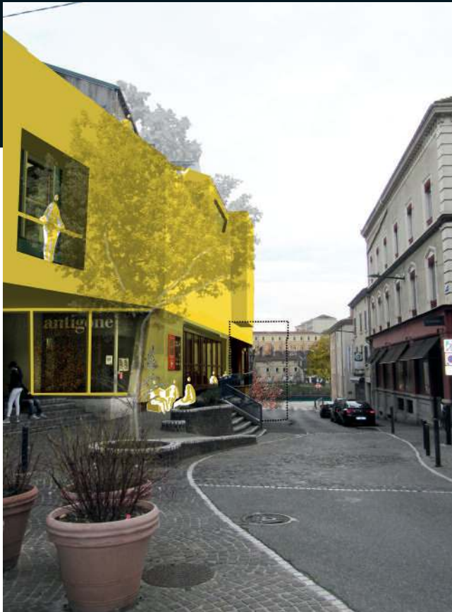
Retrouver les perspectives vers le grand paysage - Isère et Vercors - et embellir les façades.