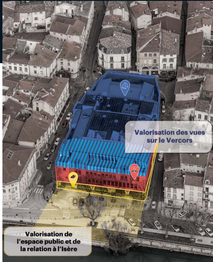
Accueillir de nouveaux usages en complément de la médiathèque et du Tribunal de commerce